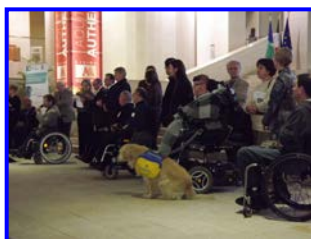
Le Collectif Handi Cap Aquitaine lors du Forum 2013

Handi Cap Aquitaine le collectif organisateur du Forum