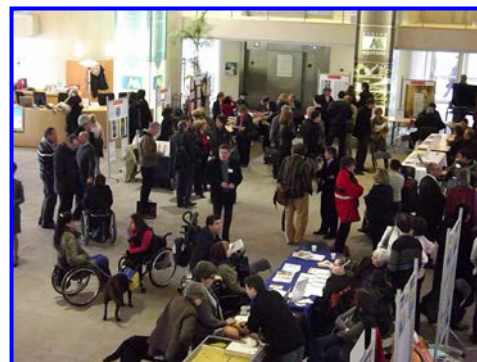
3 ème FORUM 2013 au Conseil Régional d'Aquitaine